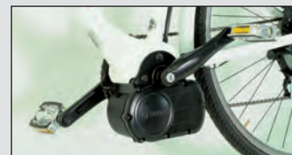
COD. 950.830.030 CLASSIC + LINE VERSION

POLINI Hi-Speed es un dispositivo electrónico diseñado para el motor Bosch para e-bike con el objetivo de evitar la parada del motor a los 25 Km/h y en consecuencia mantener activa la asistencia hasta los 50 Km/h aprovechando al máximo las prestaciones que el motor puede ofrecer. Es facilísimo de instalar, ya que los conectores se adaptan directamente a los originales. La instalación se realiza en pocos minutos. No necesita configuración ya que se autorregula. Sin batería, puesto que se autoalimenta. Puede desactivarse de forma simple desconectando un imán. El velocímetro indicará siempre la mitad de la velocidad real, lo mismo que los km. Para saber la velocidad y km basta doblar la indicada.