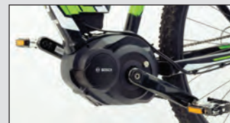
COD. 950.830.031 ACTIVE LINE PERFORMANCE LINE VERSION